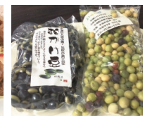
長野県小海町の 鞆掛豆