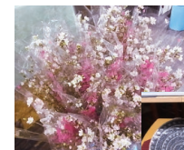
米沢市の冬に咲く桜