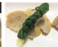
熊本県玉名市の 一文字ぐるぐる