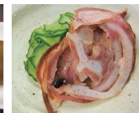
埼玉県小川町の 軟骨の燻製