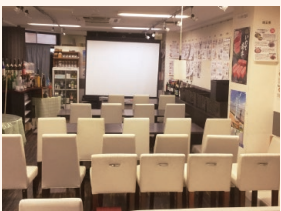
地域おこし上映会