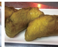
青森県上磯地域の 若生昆布のおにぎり