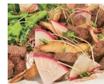
岩手県岩泉町の 安家地大根