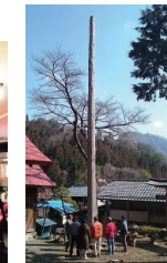
消滅可能性都市NO.1 南牧村