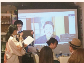
青森県移住者とネット中継中