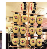
秋田市の芋灯まつり