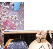
土浦市の花火玉模型