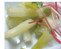
山形県米沢市の ふすべ漬け